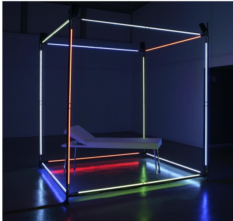
Primary Thoughts, 2001, Installation von Jaume Plensa